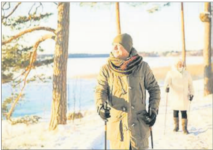
Nordic Walking durch eine verschneite Landschaft tut den Gelenken und der Seele gut.

Trotz Gelenkbeschwerden in der kalten Jahreszeit fit halten